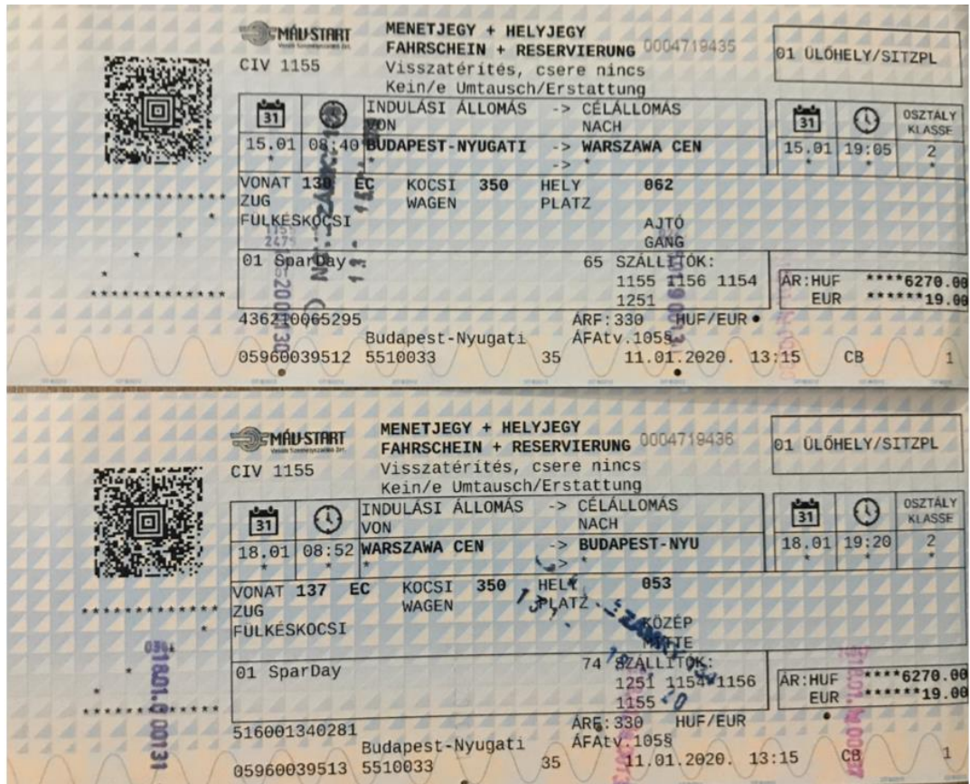
1. ábra: MÁV Nemzetközi jegyek

(amennyit elbírsz egyedül, mert kint már csak te leszel) és a menetsűrűség, közvetlen járat is mellette szólt, míg ellene csak az idő játszott (Kecskemét-Varsó kb. 12 óra, „háztól-házig” 14). A SparDay nappali járat 8:40-kor indul a Nyugatiból és 19:05-kor érkezik Varsó Central-ba, a MÁV-ot meghazudtolóan pontosan.