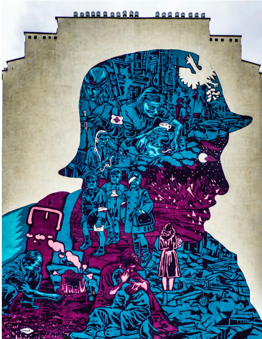
5. ábra: Egy 5 emeletes ház oldalfala, a háború szinte minden sarkon megjelenik egy-egy alkotásban

Akkor az Erasmus tanulmányi út kvintesszenciája, az Egyetem. Barátságos, családi hangulat a tanárokkal, főként, ha meghallják, hogy magyar vagy. Nagyon segítőkészek, volt eligazítás az elején, ahol minden fontosabb információt és elérhetőséget megkaptam.