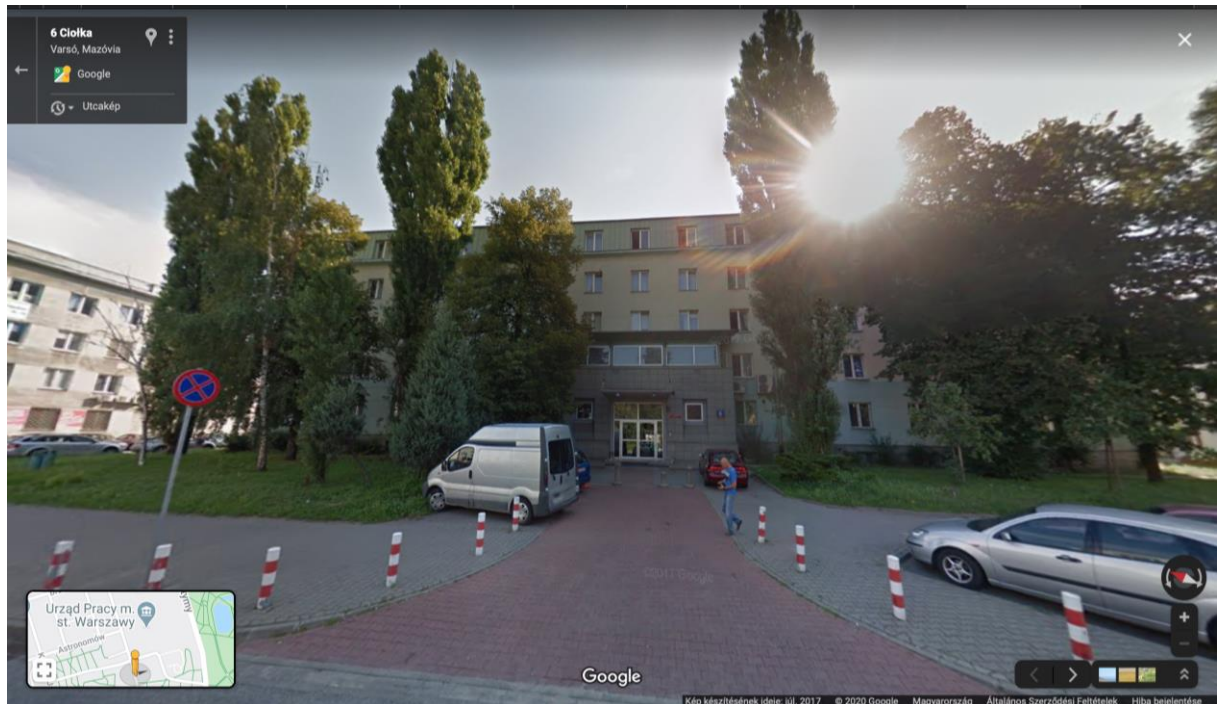
2. ábra: Kollégium épülete

Még a hétvégén gyorsan tettem egy kört a városban, Budapesthez képest rengeteg üvegfalú toronyház van, amitől rendszeren nyaki görcsöt lehet kapni, de akkor is jó. Alapvetően nagyobb terek voltak mindenhol, minden értelemben (utak, járdák, parkok), bár ez a város múltját tekintve érthető. A II. Világháború után egyetlen épület sem állt, így ment a várostervezés és rehabilitáció, jó munkát végeztek, élhető a város. A tömegközlekedés Google Maps-szal, egy nemzetközi ISIC diákkal és egy helyi bérlettel teljesen jó, tömegnyomor sem volt soha. Nem fotóztam túl sokat, de itt van pár kép az október eleji felhős időkből: