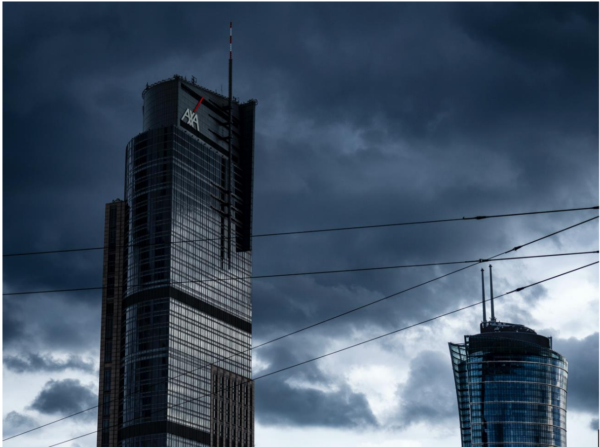
3. ábra: Toronyházak