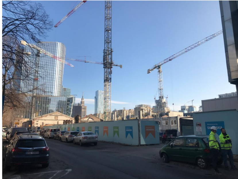
6. ábra: Az egyetem mellett közvetlenül (jobb sarokban az egyetem épületének széle)

Visszatérve Varsóra rengeteg a program minden téren. Érdeemes belépni pár városi csoportba az egyetemi és Erasmusos csoportokon kívül, mert másféle társaságokban is megismered a helyet. Ilyen volt nekem például egy fotós csoport, ahol egy 3 éve Varsóban élő londoni srác szervezett vezetett fotótúrát a mainstream helyeket kihagyva lokális kis zugokat feltárva.